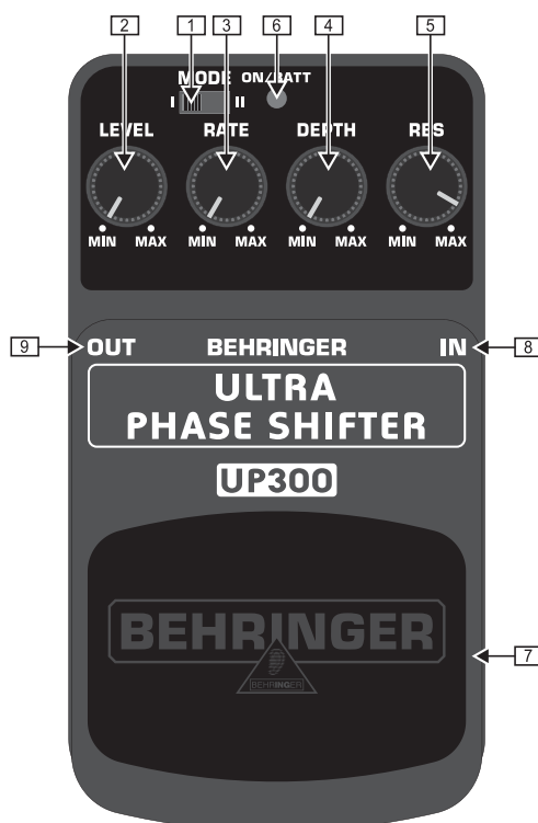
Vista lato superiore